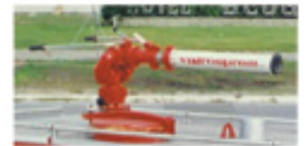
VATROGASNA VOZILA ZA GAŠENJE VODOM KAPACITETA OD 3000 DO 14000 L